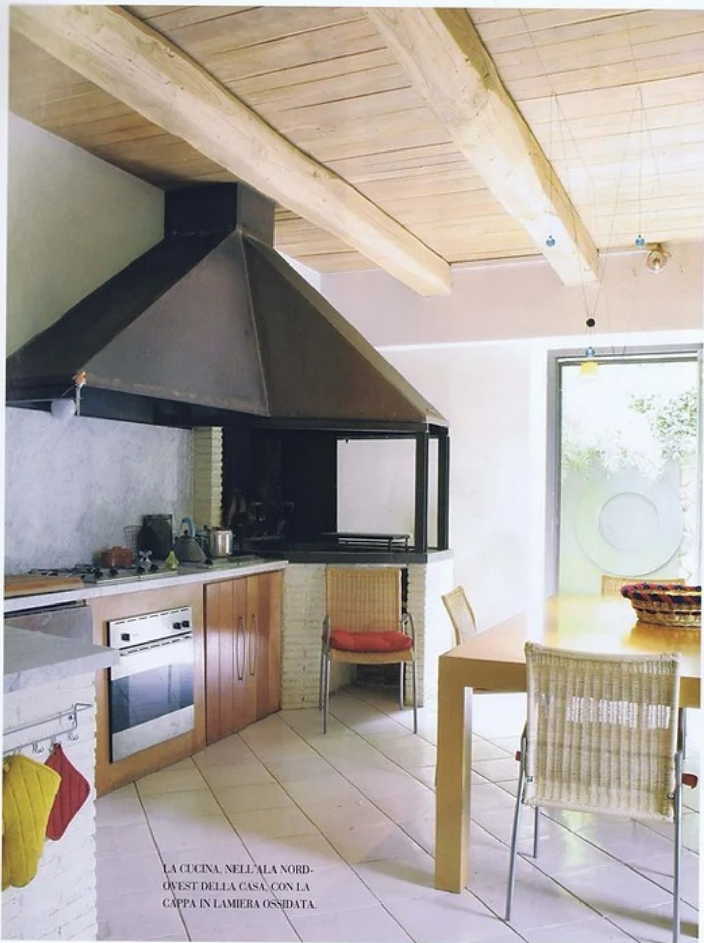
LA CUCINA, NELL'ALA NORD-OVEST DELLA CASA, CON LA CAPPA IN LAMIERA OSSIDATA.