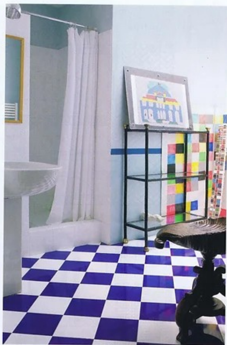
SOPRA . LA CAMERA PADRONALE E IL BACNO CON IL PAVIMENTO IN MAIOLICA BIANCA E BLU. A DESTRA . IL CASALE.

diffusione naturale del calore nei due ambienti della zona giorno. Tutti gli arredi fissi (armadi, scala, camino e porte) sono stati ideati dall'architetto, mentre il resto dell'arredo è caratterizzato dalla presenza di poltroncine di Marcel Breuer e tavoli disegnati dallo stesso De Troia. L'ala sud est della casa è contraddistinta dallo studio dell'artista, un ampio locale a doppia altezza, e da ambienti con pareti curvilinee (studio e camera da letto superiore). Tutta questa zona è costellata di pitture e di scultura, mentre il bagno rappresenta un'espansione della camera da letto padronale. Geometrie più rigorose nell'ala nord-ovest, dove si trovano un'altra camera da letto, l'ampia cucina con cappa in lamiera ossidata, sorretta da profili hi-tech, che si adatta come una scultura al piano di cottura sottostante. ➔